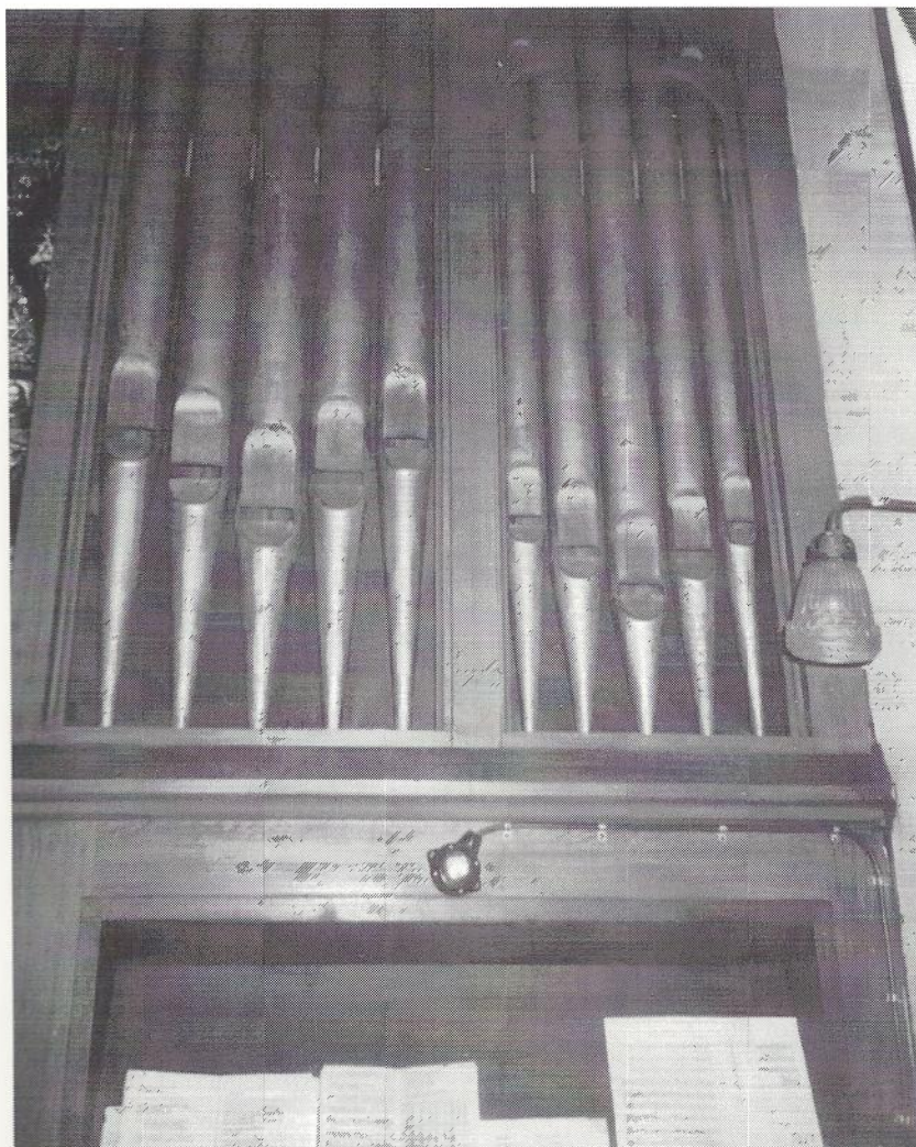
Het smalle orgelfront met de tien prestantpijpen, vlak boven het manuaal

Tot zover mijn bijdrage aan de historie over dit orgel. Het instrument staat boven op de balustrade. De opstelling is aan de zijkant van de koorzolder. Het smalle front bevat 10 prestantpijpen, gevat in wat versierd lijstwerk. Geen indrukwekkend front, met een klavier en een eerst nog aangehangen pedaal, dus zonder zelfstandige registers. In 1975 plaatste de firma Gradussen uit