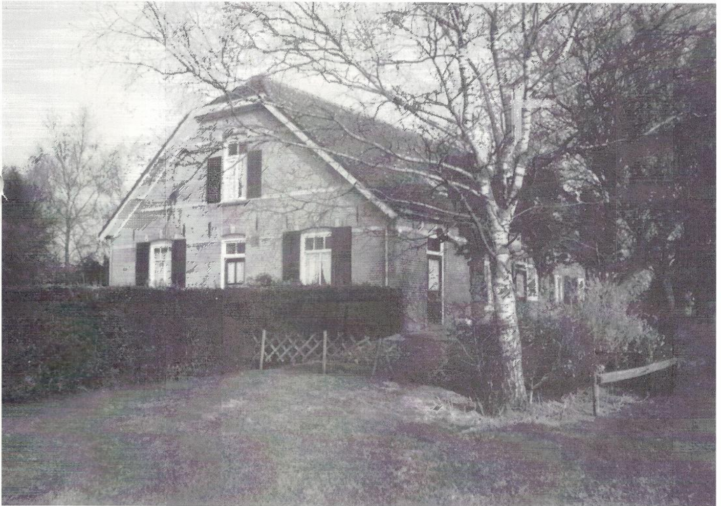
Boerderij Het Hoge Land, voorheen uitvalbasis voor het voetveer van Olburgen naar Dieren

PERIODIEK ORGAAN VAN DE HISTORISCHE VERENIGING STEENDEREN